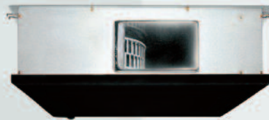
INNENTEIL DLS 18-24-30 DCI

3 Modelle Wärmepumpe von 6,0 kW bis 8,8 kW