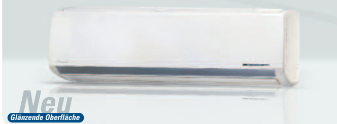
INNENTEIL PNXO 18-24 DCI