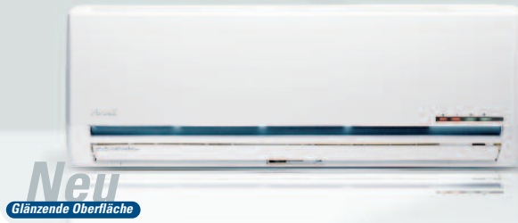
INNENTEIL PNXO 09-12 DCI

5 Modelle Wärmepumpe von 3,4 kW bis 8,5 kW