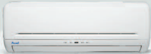
INNENTEIL PRIME 7-9-12-18

7 Modelle Wärmepumpe von 2,15 kW bis 11,2 kW