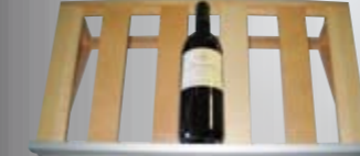
Präsentationsboden (nicht verfügbar für MaCave 15)